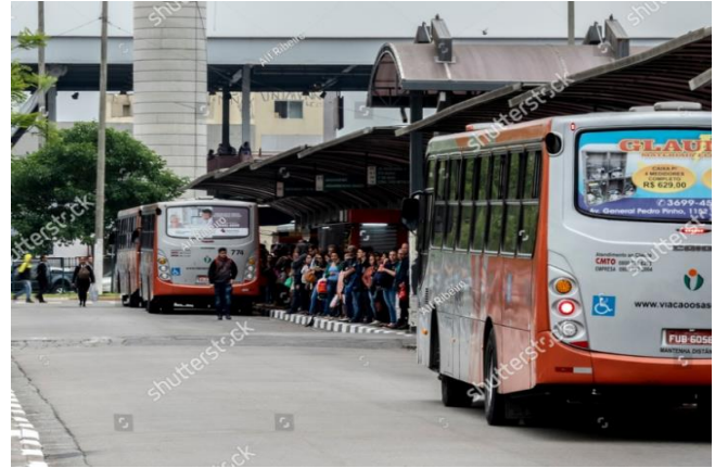
Figura 1. Aglomeración de usuarios de transporte colectivo

Las ciudades modernas cuentan con sistemas de transporte masivo como lo son camiones, trolebuses o metros, incluso trenes suburbanos. Si la gente utiliza estos medios de forma adecuada, podrá disminuir sus tiempos de traslado y en consecuencia tendrá más tiempo disponible para su trabajo, descanso, sueño o bien diversiones. Esto sería más sencillo si la gente contará con información precisa sobre las rutas de tales medios de transporte, sus horarios de llegada a los puntos de parada estaciones donde descienden y abordan los pasajeros. Otra información importante es el estatus del desplazamiento de las unidades, ubicación en la ruta, tiempo de llegada al punto de espera del pasajero, ocupación de la unidad entre otros datos. Los gobiernos de las Ciudades, los usuarios de los sistemas colectivos de transporte, organizaciones civiles sin afán de lucro y organizaciones de profesionistas relacionados con este problema realizan esfuerzos de forma continua para lograr desplazamientos más eficientes lo que redundará en comodidad para los usuarios, el uso más eficiente de los sistemas colectivos, en consecuencia, menor consumo de combustible y menor contaminación atmosférica y evitar molestias como la aglomeración de gente esperando por medios de transporte que tal vez demoren en llegar o bien no tengan lugares disponibles, como se puede ver en la Figura 1.