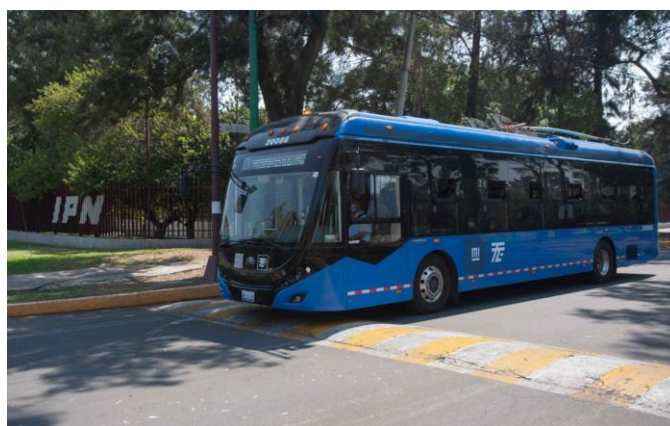
Figura 6 Unidad de trolebus

Para desarrollar el sistema decidió implementar un nodo de Internet de las Cosas para ser instalado en las unidades de transporte colectivo, este nodo debe reportar la posición de la unidad en tiempo real a un servidor/Gateway de forma que ahí se pueda consultar esta información. Un servidor de datos y de aplicaciones que permita almacenar la información de las unidades y alojar una aplicación web para que los usuarios conozcan la información del transporte público, en la Figura 6 se puede ver una unidad de la ruta de trolebuses.