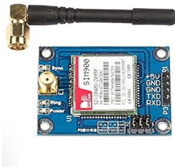
Figura 2 Placa Arduino con antena LoRa

IoT. La tecnología de Internet de las Cosas se utiliza en muy diversas situaciones y lugares, es más notoria su utilidad en las ciudades, pero sus aplicaciones pueden verse en áreas rurales y en alta mar. Un nodo IoT está instalado en algún dispositivo o máquina del cual toma información por medio de sensores de temperatura, de aceleración o inclinación, también parámetros físicos de las personas, las señales de los sensores son recolectados por medio de una computadora y ésta puede realizar acciones de control sobre el dispositivo con lo que se logra independencia de operación local. La computadora, utilizando algún puerto de comunicaciones establece comunicación con servidor que realiza varias operaciones como registrar información del nodo IoT realizar análisis de datos, albergar sistemas web para con información de ecosistemas IoT e incluso enviar órdenes a los nodos por medio de la red inalámbrica y ejecutados por la computadora en el nodo. En la figura 2 se puede ver una placa Arduino con antena LoRa para IoT [8].