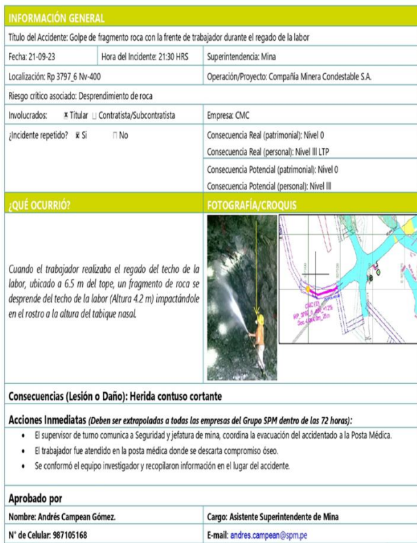
Fig. 8 Alerta inicial de incidente

Se llevarán a cabo reuniones iniciales para recopilar información sobre incidentes anteriores y las condiciones geológicas específicas de la mina, lo que proporcionará una base sólida para el análisis. Una vez identificados los peligros, se procederá a la evaluación de riesgos utilizando una matriz de evaluación. Se asignará un valor a la probabilidad y el impacto de cada peligro identificado, calculando el riesgo como el producto de ambos factores. Esta metodología permitirá priorizar los peligros en función de su severidad.