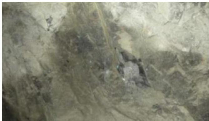
Fig. 2 Falla de interior Mina Condestable

En consecuencia, el control y monitoreo de los esfuerzos en las excavaciones es clave para la prevención de desprendimientos [16]. Es fundamental adoptar diseños y técnicas de sostenimiento que consideren tanto las propiedades geomecánicas de la roca como la redistribución de esfuerzos para garantizar condiciones seguras en la operación subterránea [4].