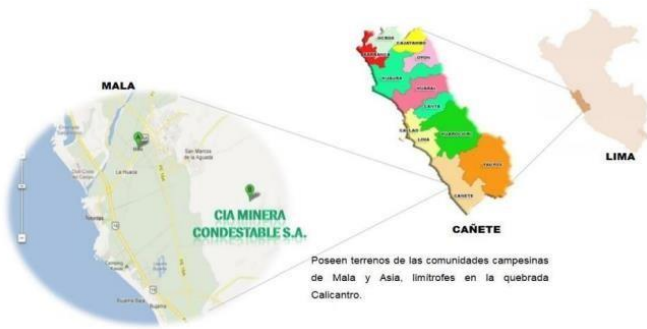
Fig. 5 Ubicación de la mina Condestable