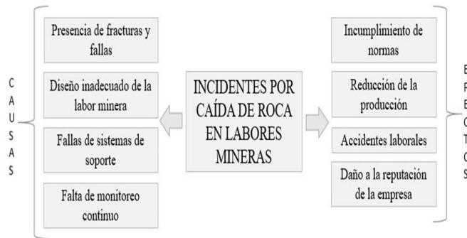
Fig. 3 Diagrama causa-efecto

en la reducción de incidentes en minas subterráneas, sino que también contribuirá a la mejora de las condiciones laborales en yacimientos de alta complejidad geotécnica, como los IOCG [19]. La metodología PHVA, permite un análisis detallado de los factores causales de los desprendimientos de rocas, mediante la evaluación continua de riesgos y la implementación de estrategias preventivas adaptadas a la geología y estructura del yacimiento [6].