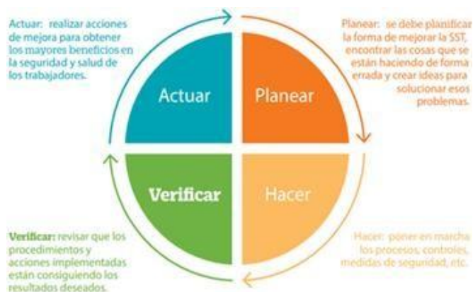
Fig. 1 Método ciclo PHVA

La metodología PHVA (Planificar-Hacer-Verificar-Actuar) se presenta como una herramienta eficaz para la gestión de riesgos en la prevención de incidentes por caída de rocas en minería subterránea. La implementación de esta metodología permite establecer un ciclo continuo de mejora que no solo ayuda a identificar riesgos, sino también a tomar acciones correctivas y preventivas basadas en datos precisos y análisis geotécnicos [16]. Uno de los principales desafíos de aplicar la metodología PHVA en un contexto minero es la necesidad de adaptar los planos de acción a las condiciones geológicas dinámicas y los comportamientos impredecibles del terreno, propios de la actividad subterránea. No obstante, los beneficios son significativos: el PHVA no solo facilita una mejora continua en los procesos de seguridad, sino que también proporciona una estructura clara para la evaluación y gestión del riesgo, siendo compatible con otras herramientas de apoyo, como el monitoreo en tiempo real de la estabilidad del terreno y las inspecciones geomecánicas periódicas [13]. Además, esta metodología fomenta un enfoque proactivo en lugar de reactivo, reduciendo así la ocurrencia de incidentes y contribuyendo a una operación más segura y eficiente.