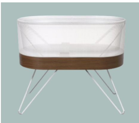
Fig. 3 Moisés Snoo

Los moisés de diseño avanzado, como el SNOO Smart Sleeper Bassinet, representan una evolución en el diseño de espacios de descanso seguros para bebés. Desarrollado por el Dr. Harvey Karp, este moisés combina movimiento automático y ruido blanco para calmar al bebé de forma efectiva. Su sistema de sujeción mediante un saco de dormir integrado asegura que el bebé permanezca en una posición boca arriba, la cual es recomendada por pediatras para reducir el riesgo de Síndrome de Muerte Súbita del Lactante (SMSL). El SNOO detecta automáticamente el llanto del bebé y ajusta la velocidad del balanceo y la intensidad del sonido para calmarlo [8]. Este producto ha sido aprobado por la FDA debido a su eficacia en mantener a los bebés seguros mientras duermen y es considerado uno de los moisés más avanzados tecnológicamente disponibles en el mercado. Fig. 3.