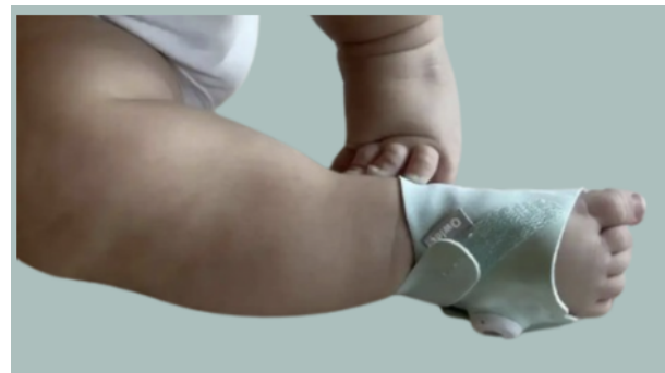
Fig. 2 Owlet Smart Sock

El Owlet Dream Sock es otro producto innovador en el campo de la seguridad infantil, diseñado para monitorear indicadores críticos como la frecuencia cardíaca y los niveles de oxígeno durante el sueño del bebé. Este calcetín inteligente se ajusta al pie del bebé y transmite los datos a una aplicación móvil, donde los padres pueden monitorear en tiempo real las tendencias de sueño y recibir alertas si los parámetros del bebé se desvían de los valores normales. Su diseño no solo permite supervisar la salud del bebé, sino también proporcionar a los padres información detallada sobre patrones de sueño, lo que puede ser útil para establecer rutinas más saludables y seguras [7]. Este dispositivo ha ganado popularidad debido a su enfoque no invasivo y la facilidad con la que se integra en la vida cotidiana de las familias. Fig. 2.