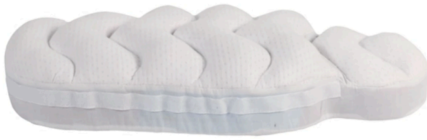
Fig. 6 Colchón ergonómico WAWA

El uso de materiales adecuados, como espuma de alta densidad y tejidos de algodón, contribuye a proporcionar un entorno seguro y cómodo para el descanso del bebé. Asimismo, el diseño compacto y liviano del moisés facilita su transporte y adaptabilidad en diversos escenarios, lo que incrementa su utilidad para los cuidadores. Las pruebas de validación confirmaron la eficacia de su estructura anatómica para prevenir deformaciones craneales y su estabilidad general para evitar deslizamientos.