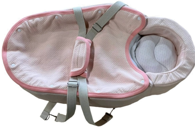
Fig. 7 Ensamble de moisés ergonómico WAWA