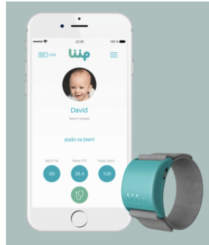
Fig. 1 Pulsera Liip

como un dispositivo médico oficial, su utilidad radica en ofrecer a los padres datos constantes sobre la salud de sus hijos, brindándoles mayor tranquilidad durante el sueño del bebé [6]. La pulsera Liip ha sido destacada por su capacidad de detección temprana de problemas respiratorios o cambios fisiológicos que podrían representar riesgos significativos para el recién nacido. Fig. 1.