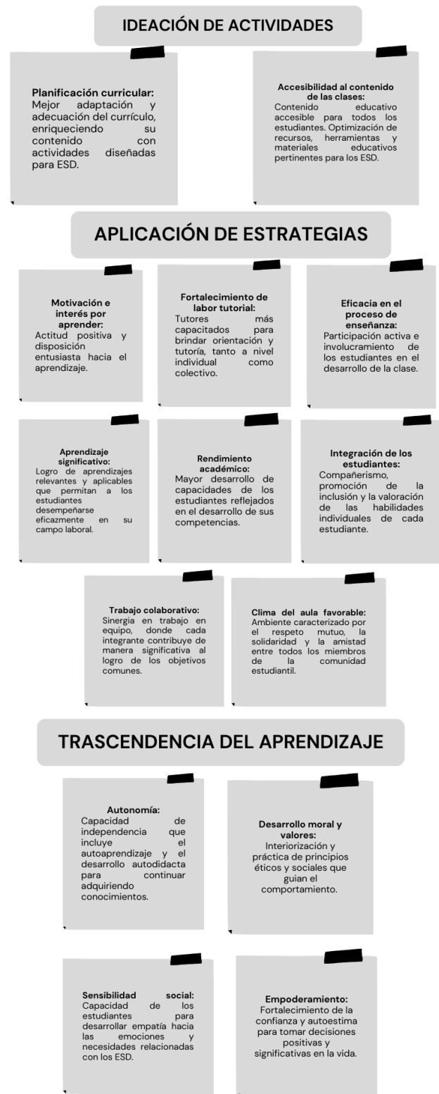
Fig. 2 Categorización de los tipos de impacto

En la Figura 2 se presentan los tipos de impacto agrupados en tres categorías principales: ideación de actividades, aplicación de estrategias y trascendencia del aprendizaje. Además, se detalla la explicación correspondiente a cada tipo de impacto, basada en los hallazgos obtenidos del análisis de los 40 artículos seleccionados.