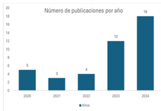
Fig. 2: Publicaciones por año

Cabe destacar que en la revisión sistemática de la literatura se recopiló información de un total de 47 artículos, lo que facilita una comprensión integral del impacto de la gamificación en los procesos de formación e innovación empresarial. Es importante señalar que estos artículos seleccionados ofrecen estudios empíricos y análisis teóricos que demuestran cómo se han implementado diversas técnicas de gamificación en contextos organizacionales, proporcionando una base sólida de datos y experiencias prácticas. Este enfoque variado en la selección de fuentes permitió una exploración exhaustiva y contextualizada del tema, garantizando que los hallazgos sean tanto relevantes como aplicables.