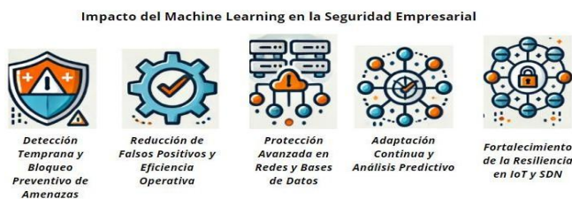
Fig. 4: Impacto del Machine Learning en la Seguridad Empresarial

Para las empresas, el uso de machine learning implica reducción de interrupciones operativas [1], [4], [32], [12], [5] y menores costos de recuperación [3], [4], [5], [17], [20] al responder rápidamente a ataques. Esto también disminuye pérdidas financieras [3], [19], [5], [14], [27] y protege la reputación de la marca [3], [4], [8], [10], [12], [27], optimizando así costos operativos [3], [4], [18], [27], [32] al reducir la frecuencia y gravedad de los ataques