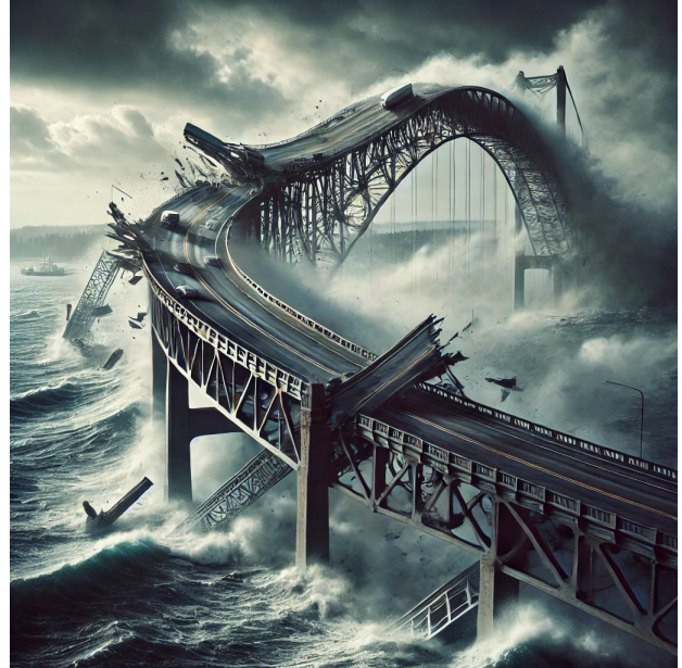
Figura 1: Representación dramática del colapso del Puente Tacoma Narrows en 1940, mostrando el momento en que la estructura se retuerce y cae en el agua debido a la resonancia inducida por el viento.

estudio detallado de sistemas vibratorios con amortiguamiento localizado.