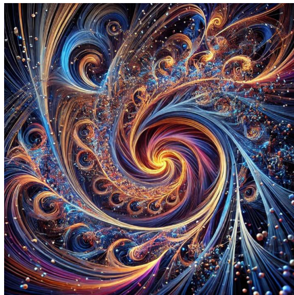
Figura 2: Atractores globales en sistemas dinámicos, utilizando un espacio tridimensional para mostrar trayectorias convergentes y estructuras complejas.

donde S(t) es el operador de semigrupo asociado al sistema [2].