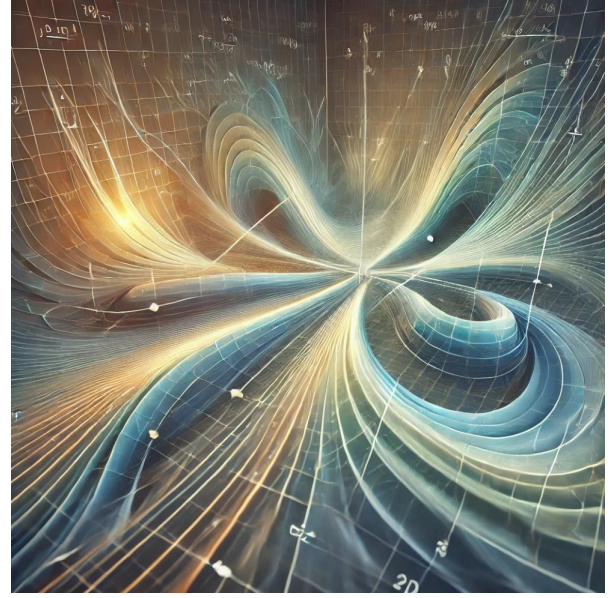
Figura 3: Rayos que cumplen la condición de Cauchy Generalizada (GCC) en el contexto de ecuaciones en derivadas parciales.

Los rayos se propagan en un dominio 2D y reflejan tanto en superficies curvas como rectas, mostrando trayectorias suaves que destacan los ángulos de incidencia y reflexión.