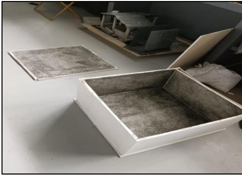
Fig. 7 Caja reverberante con la capa de mortero modificado.