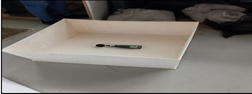
Fig. 8 Caja reverberante sin capa de mortero modificado

La superficie de prueba para materiales absorbentes planos se encuentra dentro de un rango de 10 a 12 m 2 en una cámara de 200 m 3 . En espacios con mayor volumen, el límite superior estará determinado por la fórmula V/200 \text{ m}^3)^{2/3} . Además, las dimensiones de la muestra deben cumplir con una proporción de ancho a largo.