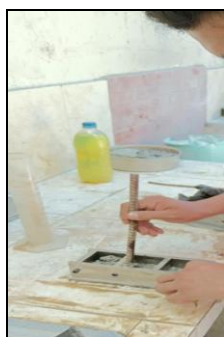
Fig. 3 Colocación del mortero en los moldes.

Se realizaron ensayos de laboratorio de resistencia a la compresión de morteros con cemento hidráulico de acuerdo con la Norma NTE-INEN 488, usando cubos de 50 mm de arista. Para la preparación de los moldes utilizados no deben tener más de tres compartimientos cúbicos como se muestra en la Fig. 3. Antes de colocar la mezcla se aplica una capa de aceite que actúa como un agente desencofrante para evitar adherencias. Luego para el llenado de los moldes en capas, se aplicó un total de 32 golpes con el apisonador por capa. Se procede al almacenamiento de las muestras, desencofrado después de las 72 horas tras el fraguado. Para determinación de la resistencia a la compresión, las muestras se ensayan inmediatamente después de retirarlas del gabinete húmedo, para este estudio fue después de 1 hora como lo indica la norma.