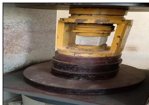
Fig. 5 Prueba de resistencia.