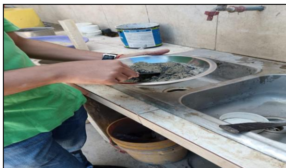
Fig. 2 Mezcla con los materiales reciclados.