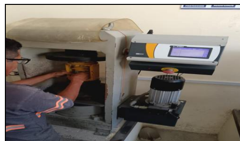
Fig. 4 Preparación de la muestra para prueba de resistencia.

Para el ensayo de resistencia a la compresión, se utilizaron 12 cubos fueron organizados en grupos de tres para romperlos a los 7, 14 y 28 días. En la Fig. 4 y fig. 5 se muestra el procedimiento de la prueba con el equipo utilizado.