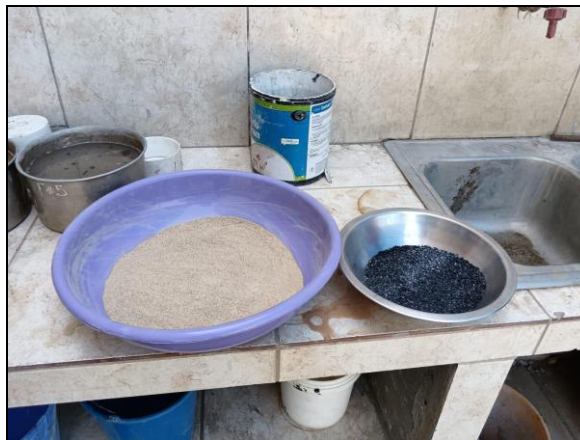
Fig. 1 Materiales reciclados para la utilización del mortero modificado.

No tiene que contener sustancias químicas, libre de aceites y materiales orgánicos. Se utilizó agua de la red pública de abastecimiento.