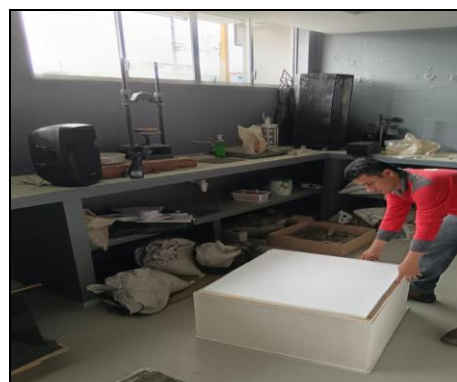
Fig. 6 Caja reverberante utilizada para la prueba acústica.

En el diseño de las cajas se ha considerado las especificaciones de la Norma UNE-EN ISO 354:2004, que establece los métodos para la medición de la absorción acústica en una cámara reverberante. En la Fig. 6, Fig. 7 y Fig. 8, se muestra en una escala 1:12,6 .