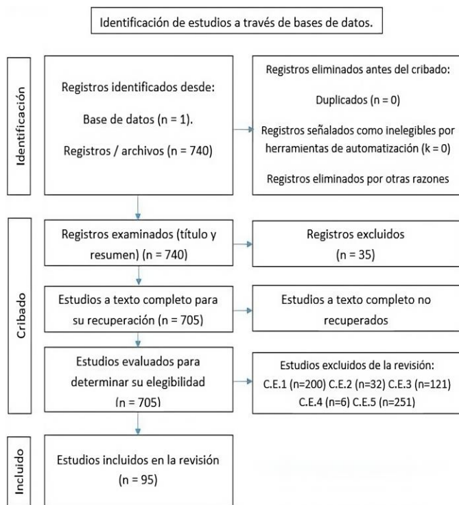
Fig. 1 Resultados de las etapas del proceso de selección de la bibliografía.