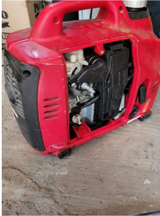
Fig. 5. Electrogenerador