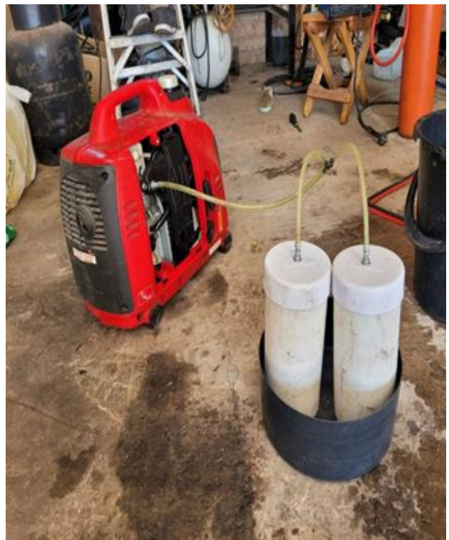
Fig.8 Prototipo de la experiencia. Vista 2.