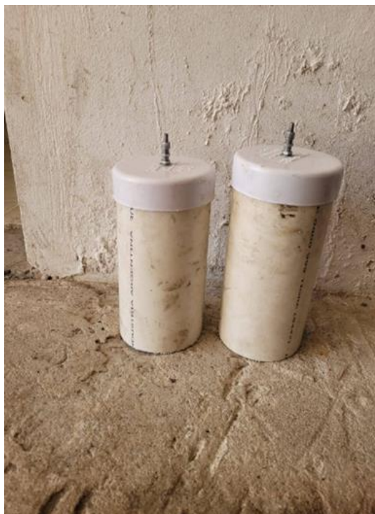
Fig. 4. Contenedores de oxígeno e hidrógeno, respectivamente