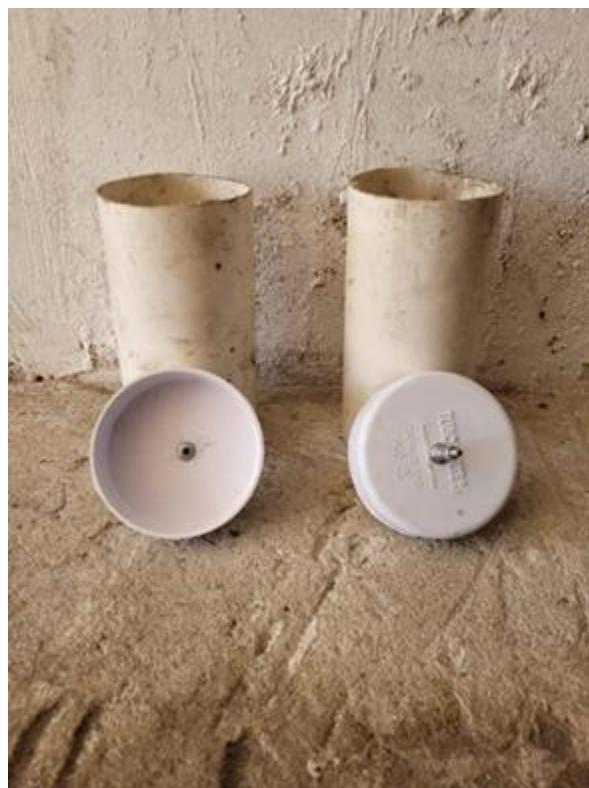
Fig. 3. Taps de recipientes contenedores de ánodo y cátodo

alternativo, no contaminante y realizar la demostración práctica de su proyecto para sus pares.