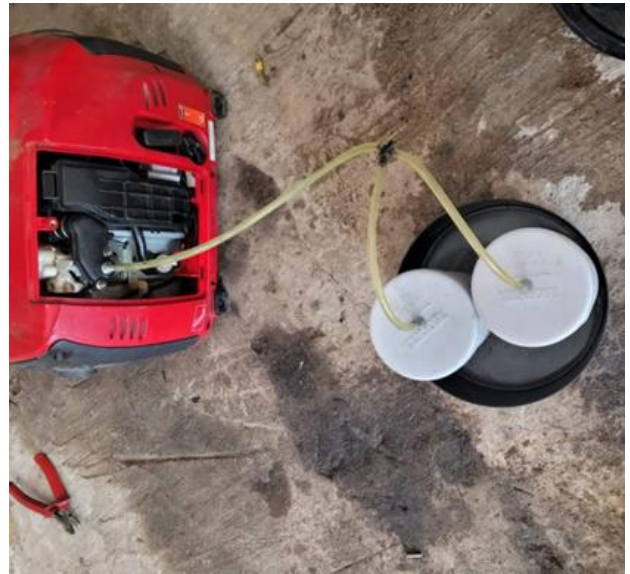
Fig. 7 Prototipo completo. Vista 1.