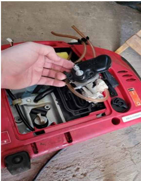
Fig.6 Adaptación del inyector.