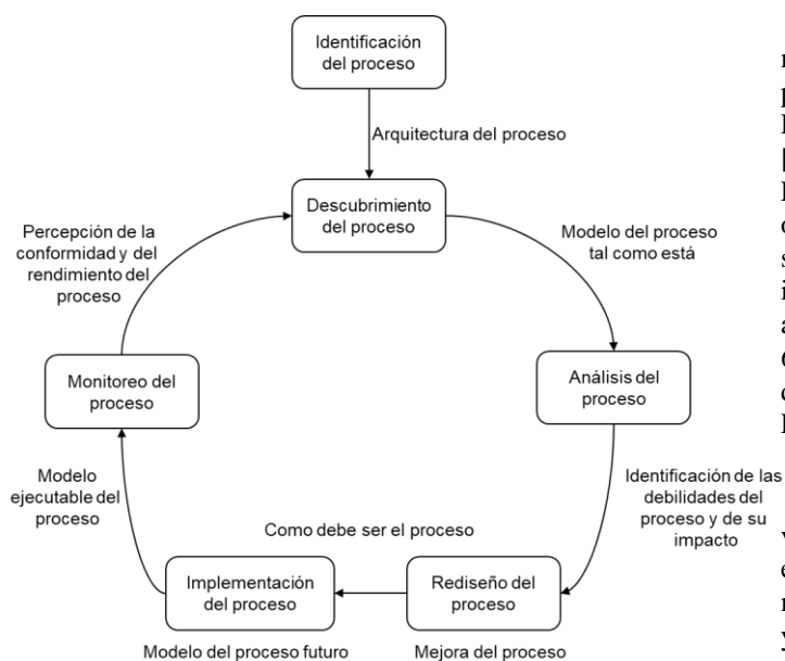
Fig. 1. Fases de la etapa de arquitectura del proceso

Teniendo en cuenta las investigaciones previas y los modelos diseñados y validados por instituciones de reconocido prestigio, como el Departamento Administrativo de la Función Pública de Colombia [7], Banco Interamericano de Desarrollo [8] y Consorcio Internacional que desarrolla el Manual de Escala de Eficacia y Eficiencia Organizacional [9] y con el objetivo de evaluar la arquitectura de proceso de gestión de servicios judiciales de la Rama Judicial, se realizó la identificación de seis factores críticos para el proceso, tabla 2; a partir de los cuales se diseñó un instrumento que consta de 63 preguntas, el cual fue aplicado a los Servidores Judiciales del Centro de Servicios Judiciales para Adolescentes de Pereira.