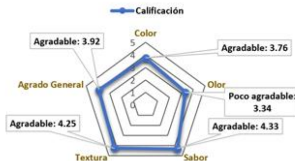
Fig. 3 Valoración obtenida por cada dimensión

Nota: Se evidencia que 3 de las 4 dimensiones evaluadas tuvieron un nivel "Agradable". La dimensión con menor valoración fue el "olor".