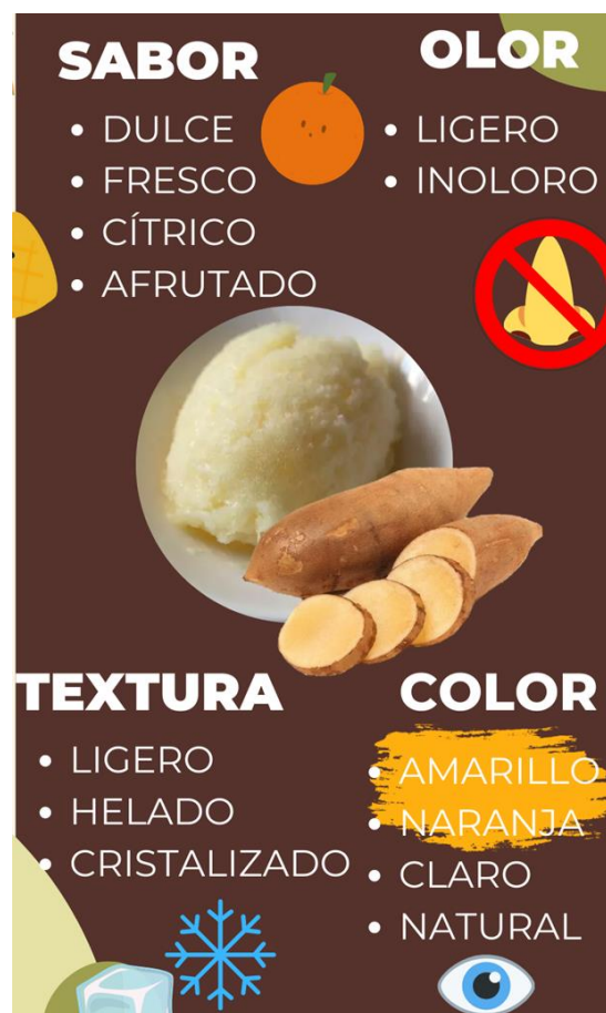
Fig. 2 Características de mayor relevancia expresada por los participantes

Nota: Se evidencia que el 55.3% de los participantes consideró que el producto era agradable y el 2.4% consideró que no era agradable.