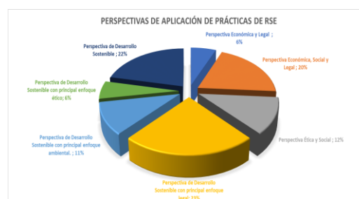
Fig. 3 Perspectivas de aplicación de las prácticas de Responsabilidad Social Empresarial

La tabla resumen muestra una tendencia de perspectivas de los autores sobre las prácticas de responsabilidad social empresarial como una herramienta para el desarrollo sostenible (62%), sobresaliendo la perspectiva de desarrollo sostenible bajo un enfoque de cumplimiento legal (23%) y la de motivación integral de desarrollo sostenible (22%). Lo siguen los autores con perspectiva económica, social y legal (19%) con trece casos, y la perspectiva ética y social (12%).