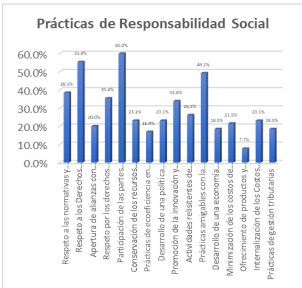
Fig. 4 Prácticas de Responsabilidad Social Empresarial más utilizadas

De acuerdo con la información de la tabla 4 e ilustración 2, se puede identificar que las prácticas de responsabilidad social empresarial más usadas fueron las de hacer participes a las partes interesadas (60%) de la toma de decisiones de la empresa, a través de charlas, reuniones, mesas de trabajo, entre otros. De igual manera, las prácticas referidas al cumplimiento y respeto de los derechos humanos de los trabajadores y sociedad (55.4%) con políticas de la empresa de inclusión de género, respeto por las creencias y religiones, reconocimiento de horas extras, prácticas de no discriminación, entre otros. Luego se encuentra las prácticas amigables con la ciudadanía, visualización de acciones y conservación de una buena reputación (49.2%) que se refiere a acciones de promoción de sus prácticas de RSE, prácticas activas y visuales, como campañas navideñas, entrega de regalos o bonos, así como la comunicación constante con sus partes interesadas.