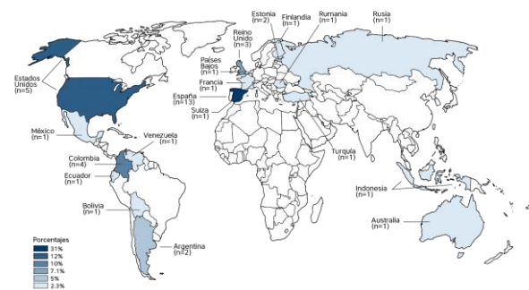
Fig. 1 Artículos seleccionados por ubicación geográfica

La tabla 2 expone la cantidad de artículos seleccionados en base al proceso de búsqueda, en donde Scopus registra un 45.3% de resultados útiles para la actual revisión sistemática. Asimismo, EBSCO cuenta con 33.3% de resultados, seguido de Dialnet con 14.2% y Google Scholar con 7.2%. En resumen, las bases de datos Scopus y EBSCO son las que registran la mayor cantidad de artículos relacionados a las variables y ámbito tratados.