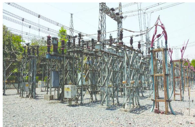
Fig. 2 Subestación aislada en aire y zona de puesta a tierra con superficie de grava

Switchgear (AIS) las cuales son las de mayor uso, estas utilizan el aire como aislante natural, tienen una envoltura externa conectada a tierra que encierra el conductor interno de alta tensión, a diferencia de los equipos convencionales cuya base más cercana es la superficie de la tierra. Dado a esto cada equipo se presenta de forma individual y distante respecto a otros, esta distancia de seguridad incrementa el espacio en su implementación [16].